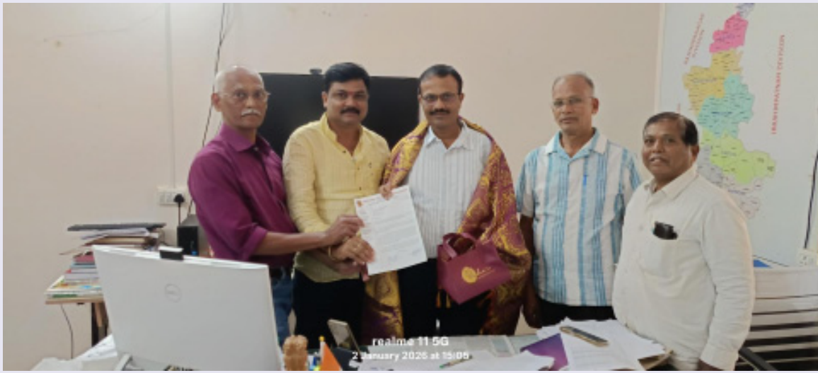
నాగోల్, జనవరి 03 (భారత శక్తి):